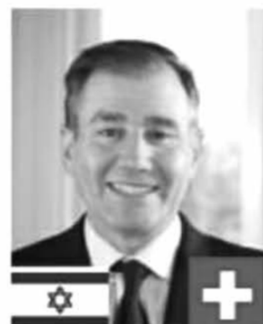
Айван Глазенберг Член Совета директоров ПАО «НК «Роснефть», Генеральный директор «Glencore International»