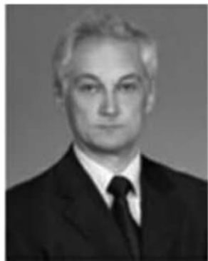
Андрей Рэмович Беловусов Член Совета директоров ПАО «НК «Роснефть», помощника президента РФ по экономике.