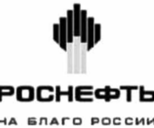
Странным образом логотип «Роснефти» напоминает семисвечник.