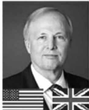
Роберт Дадли Член Совета директоров ПАО НК «Роснефть», Генеральный директор «British Petroleum»