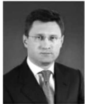
Александр Новак Член Совета директоров ПАО «НК «Роснефть», Министр энергетики РФ