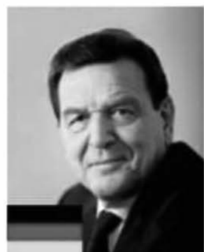
Герхард Шредер Председатель Совета директоров ПАО «НК «Роснефть», независимый директор