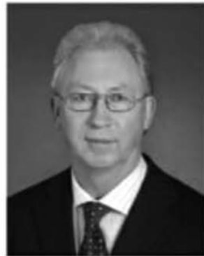
Олег Вьюгин Член Совета директоров ПАО «НК «Роснефть», независимый директор, Председатель совета директоров ПАО «САМАР»