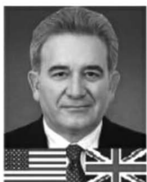
Гильермо Кинтеро член Совета директоров ПАО «НК «Роснефть», член правления «British Petroleum»