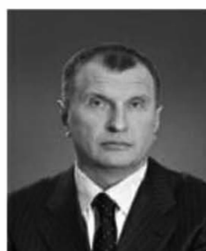
Игорь Сечин Заместитель Председателя Совета директоров ПАО «НК «Роснефть», главный исполнительный директор, председатель правления